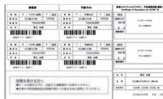
ワクチン接種クーポン券