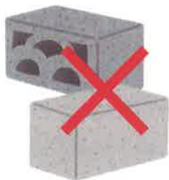
コンクリートブロック