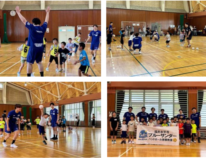
福井永平寺ブルーサンダーの選手のみなさんにハンドボール体験教室をしてもらいました！楽しくプレーできたね♪