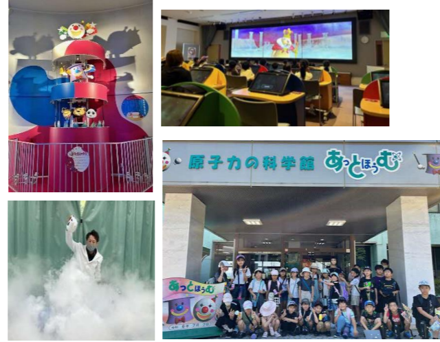
敦賀にある、福井原子力センターあっとほうむにおでかけしました！いろんな実験や体験ができて、学びの多い楽しい一日でした。