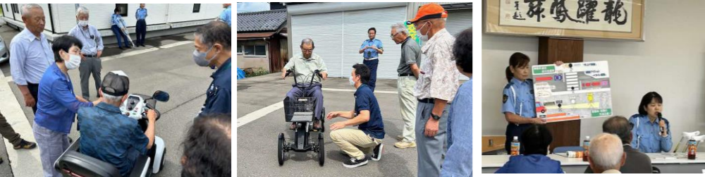
今年の交通安全教室は、健康長寿クラブさんと合同開催！サポート自転車やシニアカーの試乗もあり、参加されたみなさんから大好評でした♪