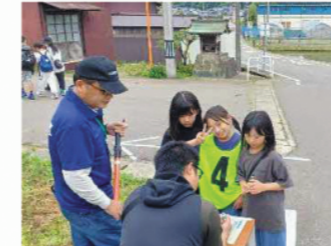
チェックを受ける参加者