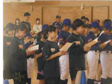
「みどりの朝風」みんなで熱唱

「時間往復走が難しかったな。」「立ち幅跳びは、結構跳んだよ。」「上体起こしは思ったより回数ができたよ。」とさまざまな感想も聞かれ、みんなが笑顔で頑張っていました。