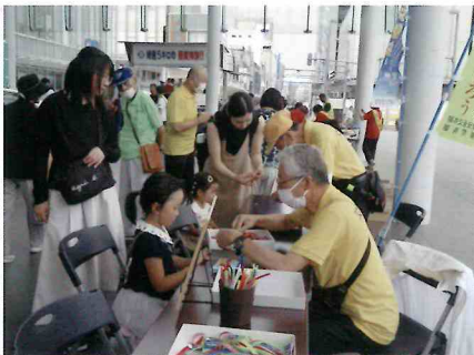
「交通フェスタ」広報活動