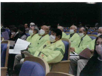
交通安全県民大会に参加