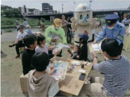
河原で飲酒運転啓発活動