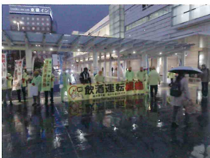
飲酒運転絶対アカン！て