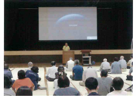
地域運転者講習会