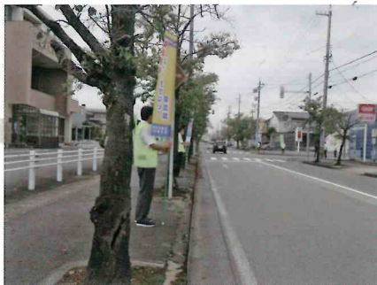
早朝交通監視活動