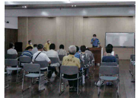
高齢者交通安全教室