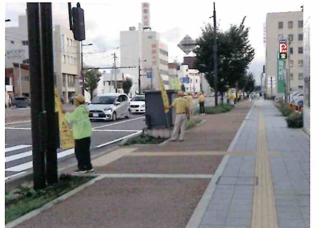
薄暮時の街頭広報