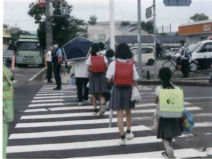
「ゆっくりん」と一緒