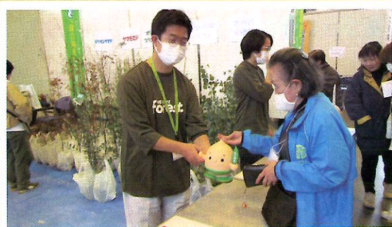
緑化苗木の配布 (敦賀市)