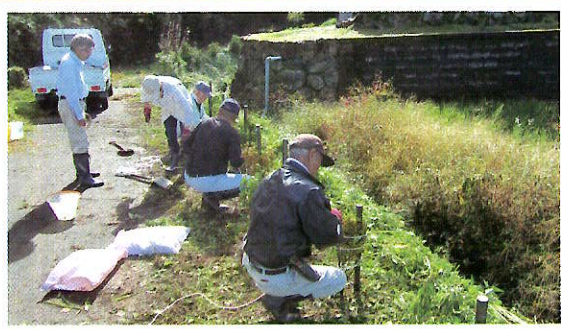
地域での植樹活動 (南越前町)