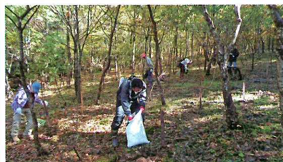
ボランティアによる森づくり活動 (永平寺町)