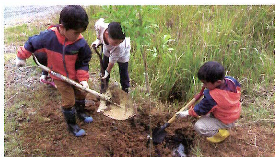
子ども達の森林学習 (若狭町)