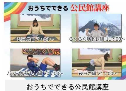
おうちでできる公民館講座