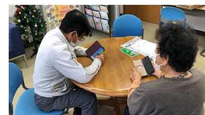
主事が教えます!LINE講座