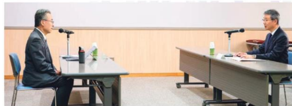
杉本知事(左)に使用済燃料対策のロードマップを説明する関西電力森社長(右)