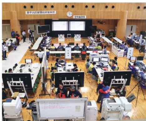
高浜原子力防災センターでの災害対策本部運営訓練の様子

県は10月20日・21日、関西電力(株)の高浜発電所を対象に原子力総合防災訓練を実施し、高浜地域の広域避難計画に基づく避難の手順等を確認しました。国、京都府、滋賀県、兵庫県、広域避難先となった兵庫県の市町、陸上・海上航空自衛隊など約100機関約2000人、住民の方々約5700人が参加しました。