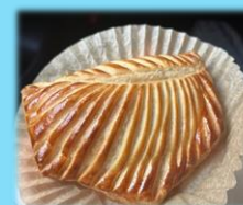
アトリエ菓修 アップルパイ