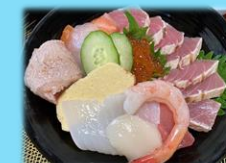
古民家みや川 海鮮丼