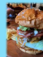
THUNDERS DINER ハンバーガー