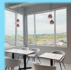
SNOW CAFÉ シフォンケーキ