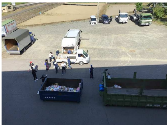
令和4年度 資源回収の様子