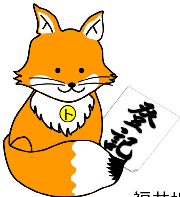
不動産登記推進 イメージキャラクター 「トウキツネ」

新制度について 詳しくは、以下の 二次元コードか、 「法務省 所有者不明」 で検索！