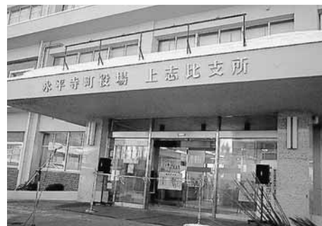
支所名初お披露目