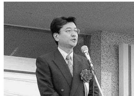
町議会議員代表あいさつ