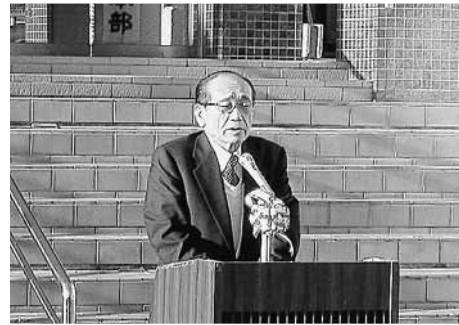
町議会議員代表あいさつ