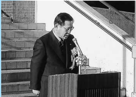
町長職務執行者あいさつ（代読）