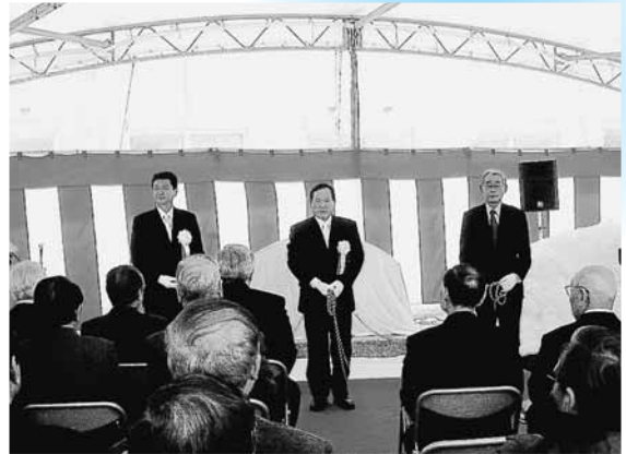
閉村記念碑除幕式