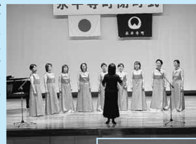
バイオレットエコーによる合唱