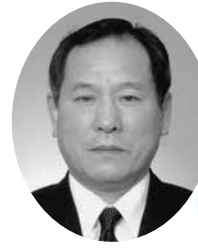
永平寺町長職務執行者 鈴木喜代宏