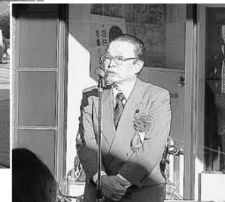
県議会議員あいさつ