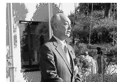
町議会議員代表あいさつ