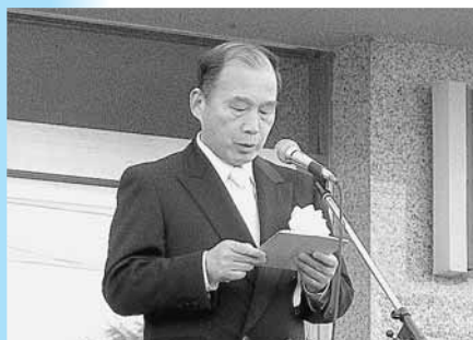
町長職務執行者あいさつ（代読）