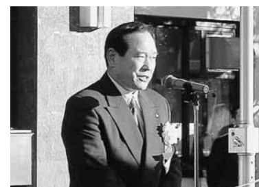
町長職務執行者あいさつ