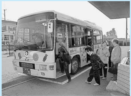
コミュニティバス（松岡地区）

また、各車内にご意見用紙を備え付けています。「コミュニティバスに関するご意見などを、お気軽にお寄せください。」