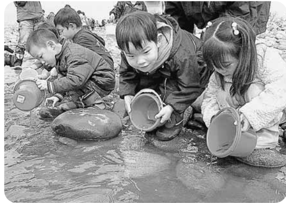
稚魚を放流する園児たち 大きくなって帰ってきてね

障害者の地域生活を支援するNPO法人「永平寺スマイルハート」の設立記念式典が3月29日、町消防本部3階大会議室で開催されました。永平寺スマイルハートは、町障害者自立支援センター（永平寺保健センター内）で、障害者への支援を幅広く行っています。さらに、町は平成20年度から地域活動支援センター事業を委託します。この事業では、3障害者の放課後障害児童預かりを主に取り組み、相談受け付けやパソコン教室を開いています。お気軽にご利用、ご相談ください。