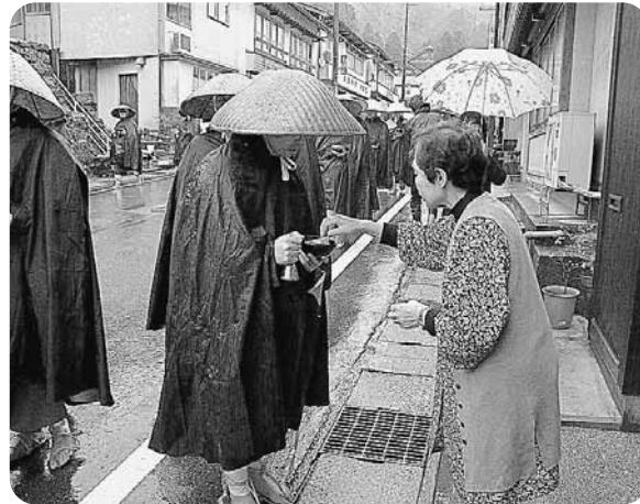
門前街での交通安全たく鉢

また、大本山永平寺で4月10日、交通安全の祈願が行われ、その後町内3地区に分かれて雲納衆による交通安全たく鉢も行われました。雲納衆が鈴を鳴らしながら門前商店街に向かうと、住民は浄財を差し出し手を合わせていました。この日の浄財は、交通安全協会を通じて交通遺児基金などに役立てられます。