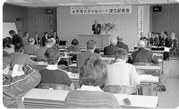
永平寺スマイルハート設立記念会 障害者の自立を支援

障害者の地域生活を支援するNPO法人「永平寺スマイルハート」の設立記念式典が3月29日、町消防本部3階大会議室で開催されました。永平寺スマイルハートは、町障害者自立支援センター（永平寺保健センター内）で、障害者への支援を幅広く行っています。さらに、町は平成20年度から地域活動支援センター事業を委託します。この事業では、3障害者の放課後障害児童預かりを主に取り組み、相談受け付けやパソコン教室を開いています。お気軽にご利用、ご相談ください。