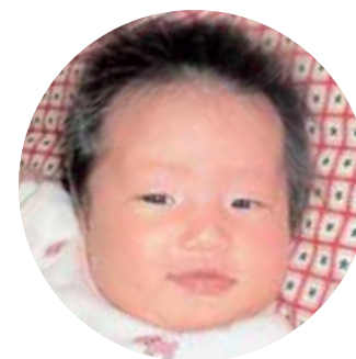
ごみ ほのかちゃん