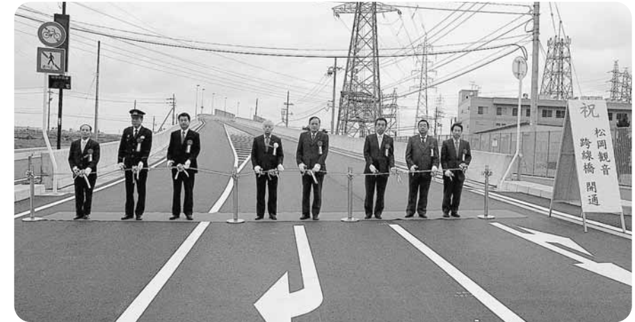
テープカットする町長ほか関係者 一般県道 舟橋松岡線「松岡観音跨線橋」開通!!

3月28日、永平寺町松岡室と福井市北野上町を結ぶ一般県道舟橋松岡線の「松岡観音跨線橋」が開通しました。