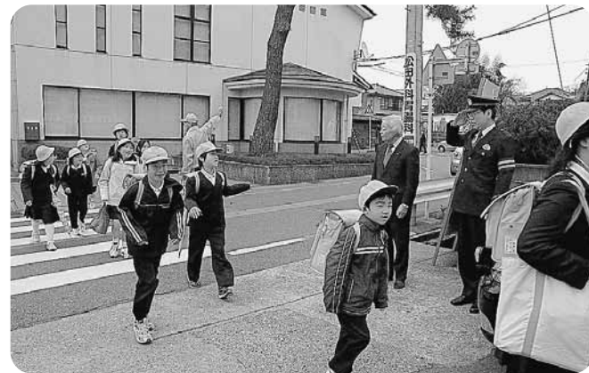
松岡小学校前での街頭指導

春の交通安全県民運動に併せて4月7日、街頭指導が行われました。永平寺署、交通安全団体会員、町議員、町職員ら約90名が、町内約50ヶ所で交通安全を呼びかけました。児童たちは、「おはよう」と元気よくあいさつをして登校して行きました。