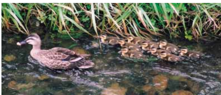
永平寺川の小さな自然 永平寺川でカモの親子がなかよくお散歩していました。 熊野神社前(東古市)