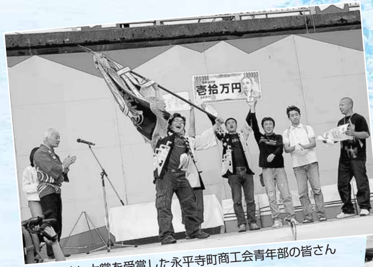
いかだ流し大賞を受賞した永平寺町商工会青年部の皆さん

初夏を告げる風物詩、九頭竜フェスティバル2008が6月1日(日)に松岡河川公園で行われました。当日は、絶好のイベント日和で、多くの人たちが賑わいました。河川では、大人気のちびっこ舟下り、各チームが団結して魅せた、いかだ流しコンテストが繰り広げられました。ステージでは、龍重太鼓、松岡メジャレッツ、天龍太鼓など子どもたちの熱心な姿を披露。太陽が沈むころになると、婦人の皆さんの総踊り、松岡地区の壮年集団による11基の山車巡行で会場を盛り上げました。その後、祭りにはかせない打ち上げ花火。今年もつながりプロジェクトの皆さんが協力を募り、夜空にかけがえのない思いを咲かせてくださいました。