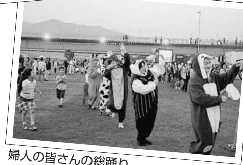
婦人の皆さんの総踊り