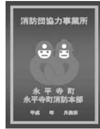
消防団協力事業所表示証