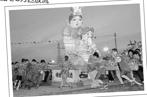
あんどん山車巡行