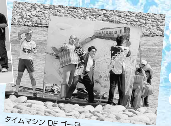
タイムマシン DE ゴー号