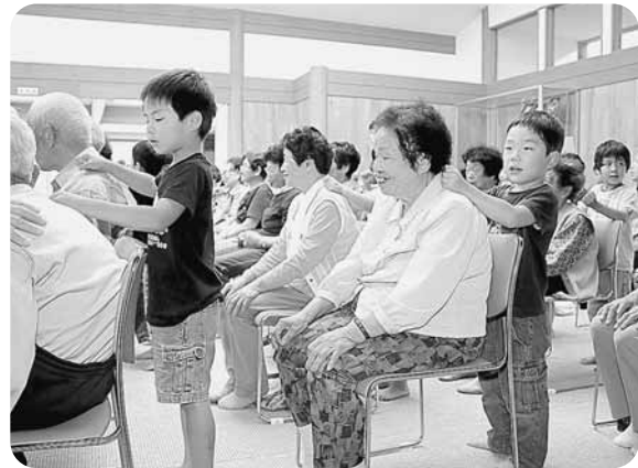
歌を歌いながら肩たたきをする園児たち