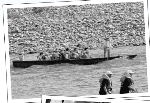
大人気のちびっこ舟下り

初夏を告げる風物詩、九頭竜フェスティバル2008が6月1日(日)に松岡河川公園で行われました。当日は、絶好のイベント日和で、多くの人たちが賑わいました。河川では、大人気のちびっこ舟下り、各チームが団結して魅せた、いかだ流しコンテストが繰り広げられました。ステージでは、龍重太鼓、松岡メジャレッツ、天龍太鼓など子どもたちの熱心な姿を披露。太陽が沈むころになると、婦人の皆さんの総踊り、松岡地区の壮年集団による11基の山車巡行で会場を盛り上げました。その後、祭りにはかせない打ち上げ花火。今年もつながりプロジェクトの皆さんが協力を募り、夜空にかけがえのない思いを咲かせてくださいました。