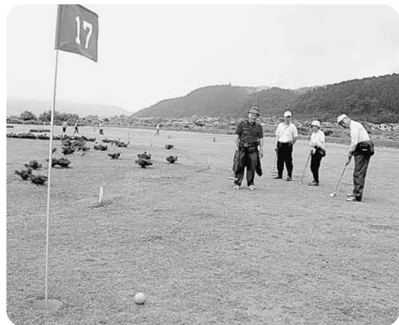
カップインをめざす参加者たち

志比幼稚園児と谷口なかよし会のおじいちゃん、おばあちゃんとの交流会が6月18日、谷口コミュニティセンターで行われました。園児たちは、「元気でね いつまでも」のフレーズが入った歌を歌いながら肩たたき。また、お年寄りたちと風船バレーなども楽しみました。会場はにぎやかな歓声が響き渡り、お年寄りも、「園児たちからたくさん元気もらった。」と満面の笑顔でした。