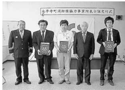
永平寺町消防団協力事業所表示証を交付された事業所の皆さん

永平寺町消防団協力事業所表示制度は、永平寺町消防団に積極的に協力している事業所またはその他の団体に対して、消防団協力事業所表示証を交付し、地域の消防防災力の充実強化などの一層の推進を図ることを目的として、制度化したものです。