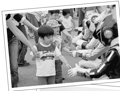
ゴーオンジャーと握手