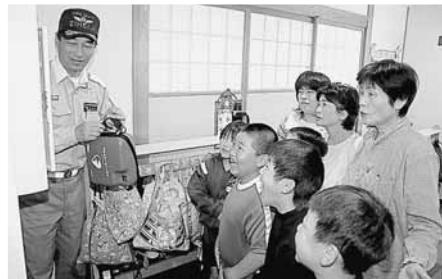
AEDの説明を受ける御陵地区の子もたち