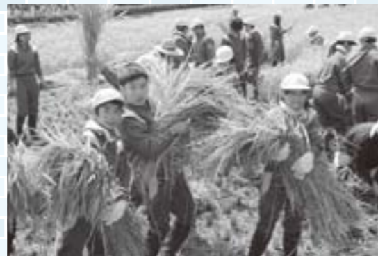
刈り取った稲を運ぶ児童

春に御陵幼稚園の畑に園児たちが植えた1本の苗。地域のおばあちゃんたちといっしょに育てたところ、直径50cmのデカかぼちゃに成長しました。重さは32.8kgと28.1kgで、園児たちにより収穫されました。園児たちは「大き〜い！」とただただ驚くばかり。園児の体重よりも重いこのかぼちゃは、現在は園の玄関に飾られています。毎日触っているため、表面にはつやも出てきました。地域の人たちも「この辺りでは見たことがない」と驚いています。