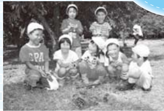
栗をいっぱい抱えて喜ぶ園児たち

自ら申し込んだ人、奥さんに行けといわれた人など参加の理由はさまざま。包丁使いもおぼつかない人もいましたが、中華丼、オニオンスープ、かぼちゃサラダの3品を2時間で完成させました。「単身赴任の経験はあるが、簡単なものしか作らなかつた。少しずつ台所にも立っていかうかな」と料理づくりに前向きな意見も聞かれました。「男性の料理教室」は松岡公民館と男女共同参画推進事業との共催で、9月中に全3回開催されました。