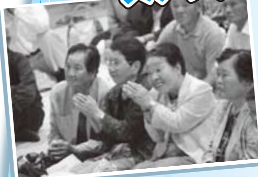
ステージでは幼稚園児の手話コーラス。かわいい発表に思わず見ているおばあちゃんの手も動きます。(9月13日 永平寺地区敬老会にて)