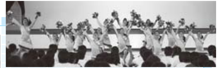
笑顔で演技を披露する「JETS」のメンバー

今年3月の全米チアダンス選手権チームパフォーマンス部門で総合優勝した福井商業高校チアリーダー部「JETS」によるダンスの公演が、