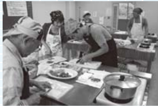
指導を受けながら野菜を切る参加者