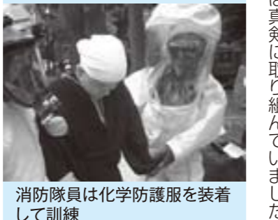
消防隊員は化学防護服を装着して訓練

参加者は協力しながら取り組んでいました。永平寺でテロ発生を想定本番ながら真剣訓練「救急の日」消防訓練