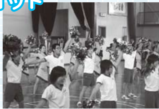
指導を受けたダンスを披露する応援団の生徒たち

上志比小学校では、理科や総合的な学習一環として稲作を取り入れました。地域の人たちの協力も得て、春の田植えや夏の草取りもして育ててきました。そしていよいよ収穫。5・6年生57人が鎌を片手に稲刈りです。家が農家でも手伝っている子は少なく、ほとんどが初体験。それでもさすがは高学年の児童です。「腰も痛いし、体がかゆい」と言いながらも、6アール分を約30分で刈り取りました。収穫された無農薬の米は10月には給食に出されるようです。