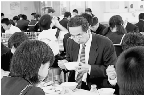
生徒たちと給食を試食

ながら給食を食べました。午後からは、観光関係の代表者11名と座ぶとん集会を行い、県と連携することで町の観光レベル向上に繋がります。この後、永平寺川に設置されたサクラマスの魚道を視察し、次の会場へと向かわれました。