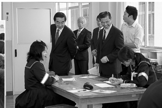
各クラスの授業を見学

ながら給食を食べました。午後からは、観光関係の代表者11名と座ぶとん集会を行い、県と連携することで町の観光レベル向上に繋がります。この後、永平寺川に設置されたサクラマスの魚道を視察し、次の会場へと向かわれました。