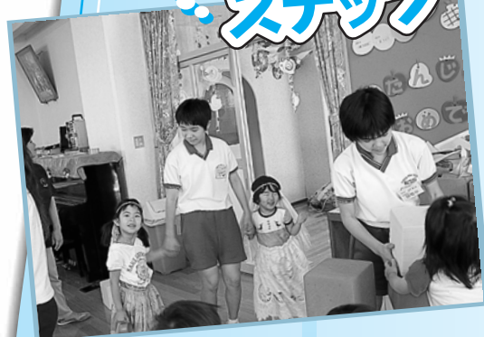
「お姉ちゃん先生と、おしゃれして遊ぶんだもん！」 2人の小さなお姫様が中学生のお姉ちゃん先生と手をつないでお遊戯場をお散歩中でした。 中学生職場体験 東幼児園にて