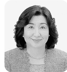
テレビでおなじみの住田裕子氏(弁護士)