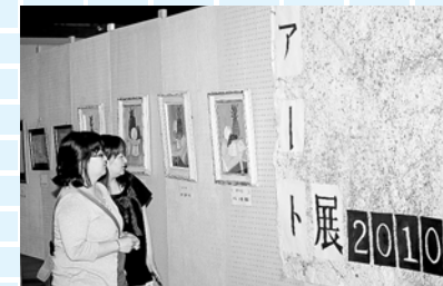
来場者の目を楽しませていた美術部のアート展