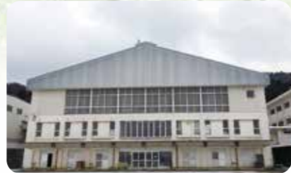
松岡中学校体育館