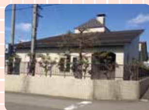
汚水中継ポンプ場

地震発生時にも、水道配水を継続するため、水道施設の建物(浄水施設・配水施設・送水施設)の耐震診断をします。