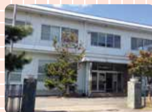
上水道管理センター