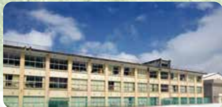
松岡小学校南校舎